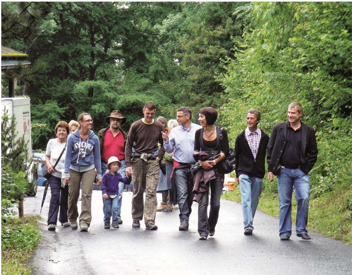
Waldsonntag 2010: Das Ziel der Exkursion beim Forstwerk ist fast erreicht.